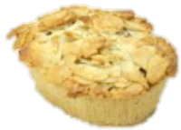
MAZARIN TOSCA (65G)