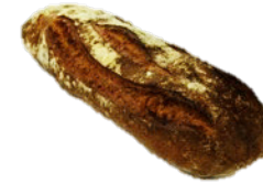
LEVAIN GRAND MÖRK (1350G)