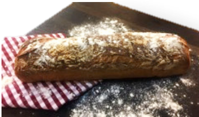
LEVAIN I FORM (1150G)