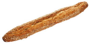
Råsunda SIRUS BAGUETTE MÖRK (500G)