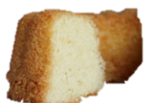
SOCKERKAKA (90G/Bit) Finns upp till 48 bitar per plåtar