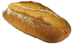
ITALIENSK GRAND (1100G)