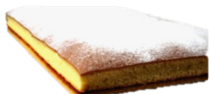
SAFFRANSBITAR (80G/Bit) Finns upp till 48 bitar per plåtar