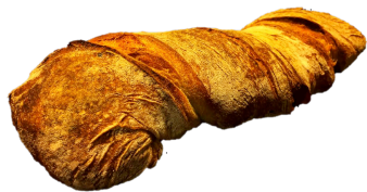
PAIN PAILLASSE BAGUETTE (400G)