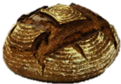
RÅSUNDA BLACK (750G)