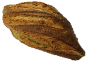
RÅSUNDA SIRUS (1000G)