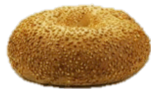
BAGEL SESAM (100G)