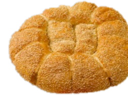
BRYTBRÖD 30 BITAR LJUS (1350G)