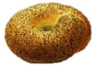
BAGEL VALLMO (100G)