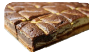
TIGERKAKA (80G/Bit) Finns upp till 48 bitar per plåtar