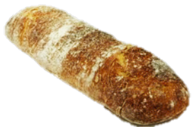
LEVAINBRÖD GRAND (1300G)