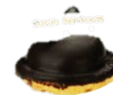
SARAH BERNHARDT (60G)